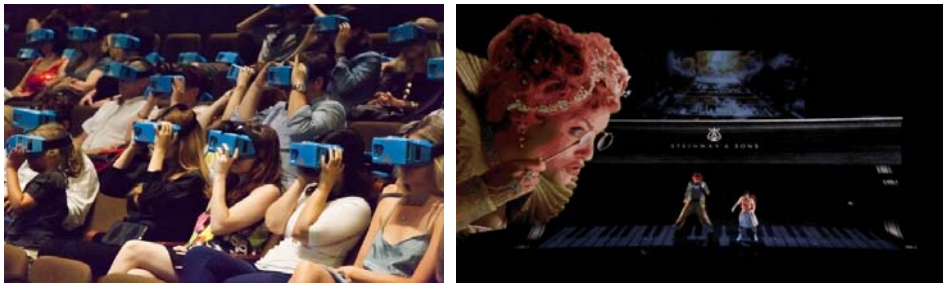
[그림 1] 스마트폰 장착 AR헤드셋(좌), AR로 보이는 무대(우)