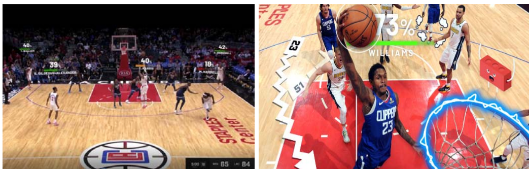
[그림 3] 폭스스포츠 앱의 코트비전 화면, 선수정보표시(좌), 애니메이션표시(우)