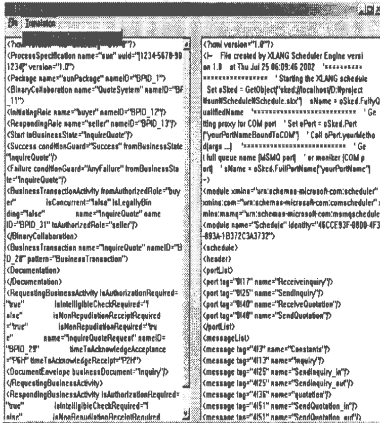
그림 2 비즈니스 프로세스 변환기에서 ebXML 비즈니스 프로세스를 BizTalk 비즈니스 프로세스로 변환한 화면